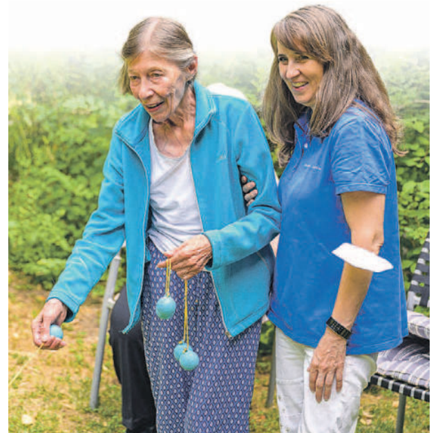
Gemeinsam geht es immer besser.